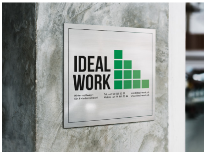
Schilder & Beschilderung