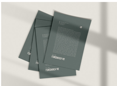
Briefpapier & Korrespondenz